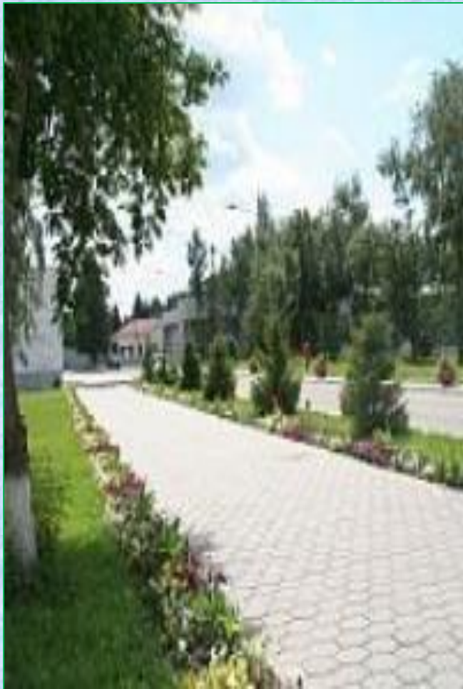
Именем Героя названа улица в Омске.